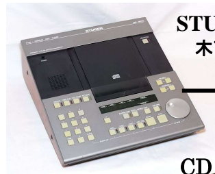
STUDER A730 木下氏遺品