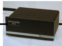
FR XF-1 MCトランス

ガラード401+オルトフォンRMG309 フェーズテック P-1G MCカートリッジ