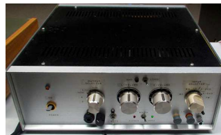
マランツタイプ プリ