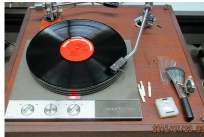
アナログレコード

ガラード401+オルトフォンRMG309 フェーズテック P-1G MCカートリッジ